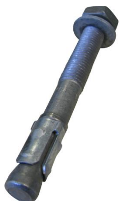
Goujon fileté galvanisé