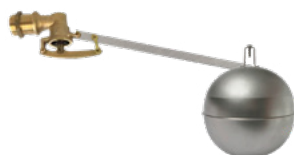
ROBINET FLOTTEUR pour une utilisation en citerne tampon. (non compris dans le kit)