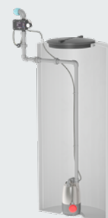
Montage dans la citerne