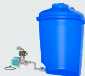
Montage hors de la citerne