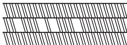
Barres à empreintes

Zone Industrielle de Jaula 97129 LAMENTIN - Tél. : 05 90 28 37 37 Fax. : 05 90 28 94 51 - www.biometal-guadeloupe.fr contact.gp@biometal.com