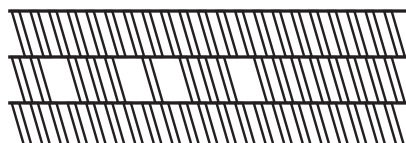
Barres à empreintes

Zone Industrielle de Jaula 97129 LAMENTIN - Tél. : 05 90 28 37 37 Fax. : 05 90 28 94 51 - www.biometal-guadeloupe.fr contact.gp@biometal.com