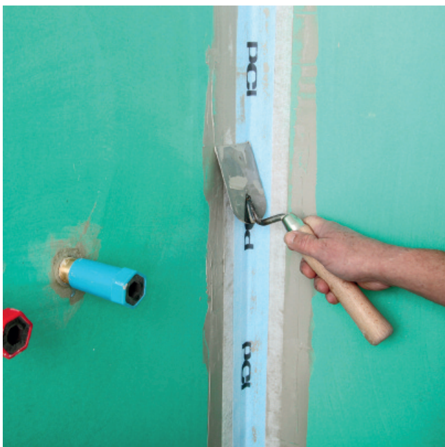
Maroufler la bande avec un outil non coupant.