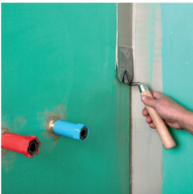
Appliquer suffisamment de produit sur le support avant de poser la bande.