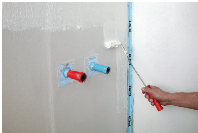
Après avoir traité les points singuliers, appliquer le revêtement d'étanchéité sur toute la surface.