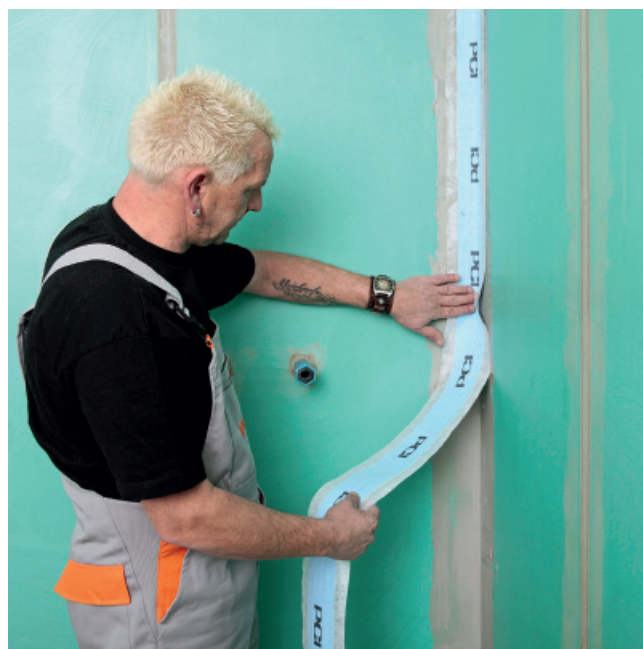
Positionner la bande à la main et presser doucement.