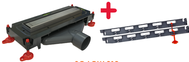
SO LOW 210