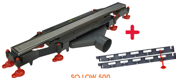
SO LOW 500