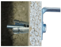
Cheville Ralfa-Multi - vue en coupe