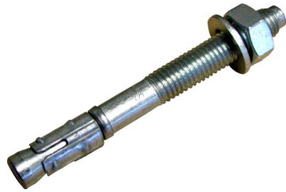
Goujon fileté Inox