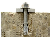
Goujon fileté FT - vue en coupe