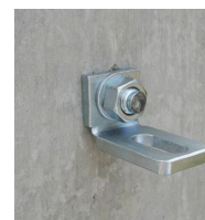
Goujon fileté FT - vue en situation