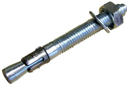
Goujon fileté FT