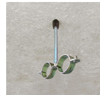
Rapido M7 - vue en situation