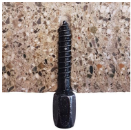
Rapido - Vue en coupe